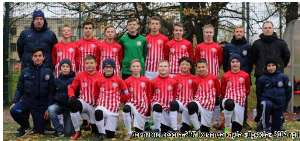
Чемпионы сезона-2017 (команда клуба «Дружба» 2004 г.р.)

Понимая степень ответственности перед товарищами и болельщиками, юные футболисты тренируются с повышенной самоотдачей, по выходным участвуют в турнирах и товарищеских матчах. На ближайшие недели запланированы встречи команд всех возрастов с коллективами клубов «Ижорец» и «Динамо». Кроме того, для наработки игрового опыта в дни весенних школьных каникул